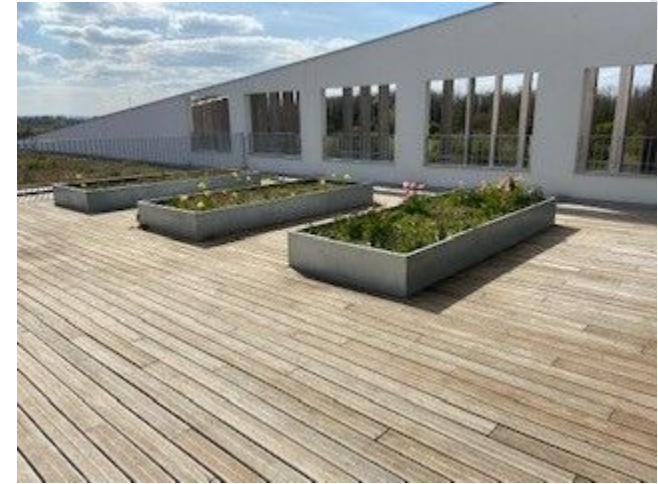
La terrasse pédagogique du collège (SVT, Eco-club...)