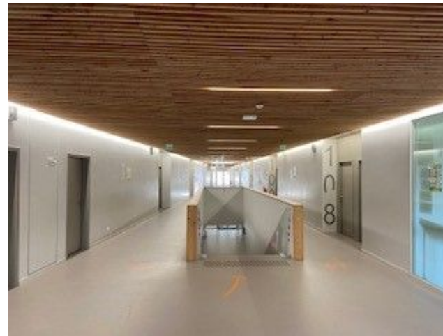
Vue du 1er étage du collège.